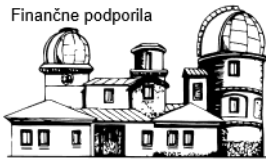
Slovenská ústredná hviezdáreň v Hurbanove